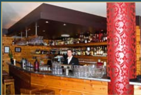
Becks Brasserie & Bar her selvsagt en bar i lokalet med et meget godt utvalg av single malt Whisky og cognac. Ønsker du en god cocktailbar, er den 10 meter unna

Menyen dekker et bredt område, og inneholder mange godsaker. Vi vil tro alle vil kunne finne noe de har lyst på her, og vi kan vel også garantere at de nok blir fornøyde i tillegg.