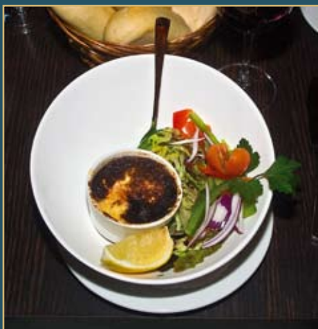
Dette er ikke Scampi, men kjempereker. Uansett, de smaker aldeles nydelig