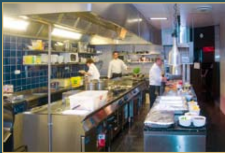
Vi tipper mange kolleger misunner kokkene på Becks Brasserie & Bar

og følgelig ikke satser på samme type service som man forventer et slikt sted. Men det er likevel vurderingsnormen. Det skal sies at det var svært lite å klage på. Vi måtte skjenke i glassene selv et par ganger, men det er altså konseptet.