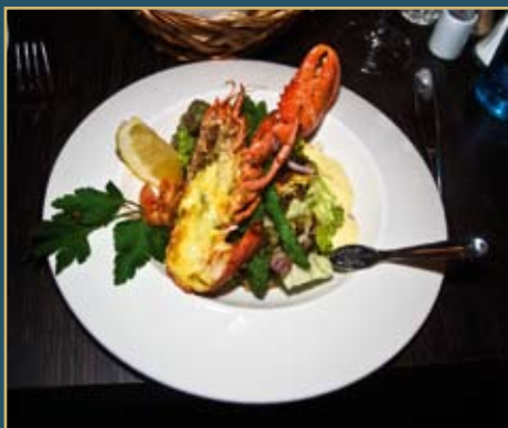
A Little Piece of Heaven! Dette er den beste hummeren vi har spist

Igjen nevner vi at Becks Brasserie & Bar ikke har gourmetrestaurant som konsept,