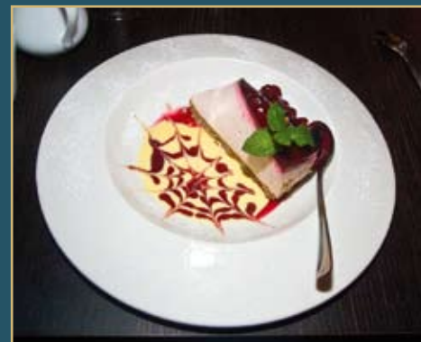
Becks ostekake er helt enkelt en drøm. Anbefales på det sterkeste